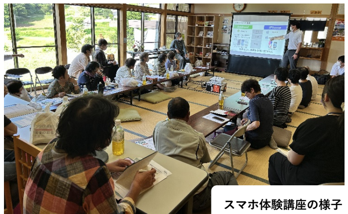
スマホ体験講座の様子

↑各サロンの紹介を1枚の紙にまとめて頂きました。紙面では小さくて読めないと思いますが、ご興味のある方は住民自治協議会事務局までお声掛けいただければA4版をお渡しすることができます。