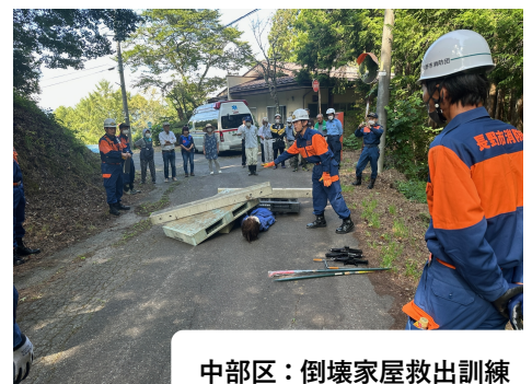
中部区：倒壊家屋救出訓練

8月27日（日）4年ぶりに大岡地区総合防災訓練が実施されました。豪雨による土砂災害を想定した訓練を実施、全地区で534名の参加にて、各区ごとに情報の収集、伝達訓練、土砂災害ハザードマップによる避難場所・経路の確認、発電機や防災備蓄品の点検確認を行いました。重点実施地区である中牧・中部の両区では新町消防署、消防団の指導・協力のもと倒壊家屋の救出訓練、応急救護所の設置、救出・救命・救護・消防訓練等を実施致しました。