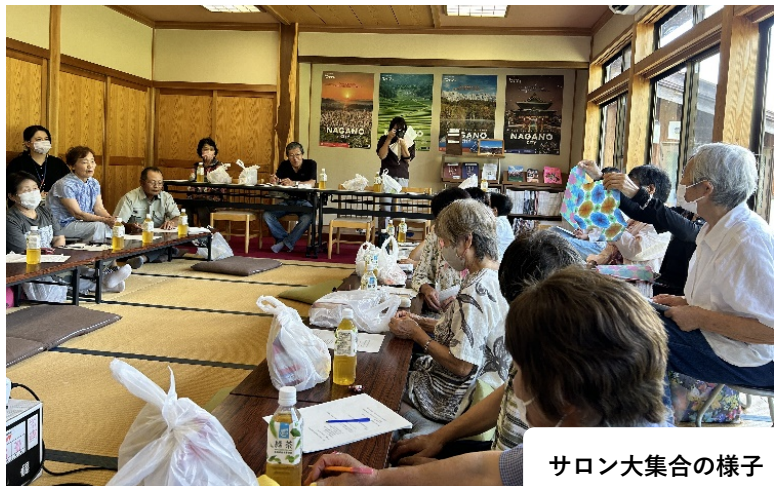
サロン大集合の様子

方にも各自1台スマホを配布して、3名の専門講師のもとスマホの触り方や音声入力の仕方などを体験してもらいました。参加した皆さまからは、このようなサロン同士の集まりはこれからも是非やりたい、やってほしいとの声があがり、来年度は「大岡サロン自慢大会」として各サロンの活動紹介や意見交換の場をつくらうということで話がまとまり、予定した2時間はあっという間に終了しました。