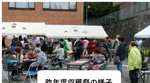
昨年度収穫祭の様子